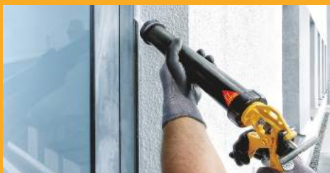
ÉPÍTŐIPARI TÖMÍTÉSEK ÉS RAGASZTÁSOK