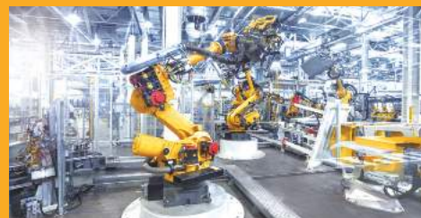
RAGASZTÓ- ÉS TÖMÍTŐANYAGOK IPARI CÉLOKRA