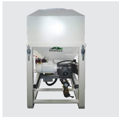
BigBag-es és zsákos felhasználáshoz