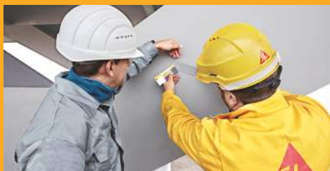
KORRÓZIÓ- ÉS TŰZVÉDELEM